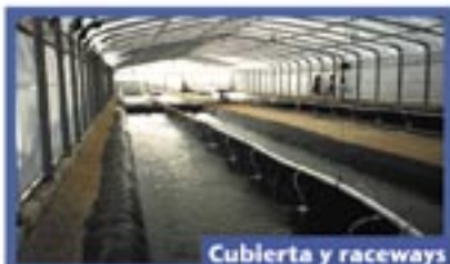
Cubierta y raceways