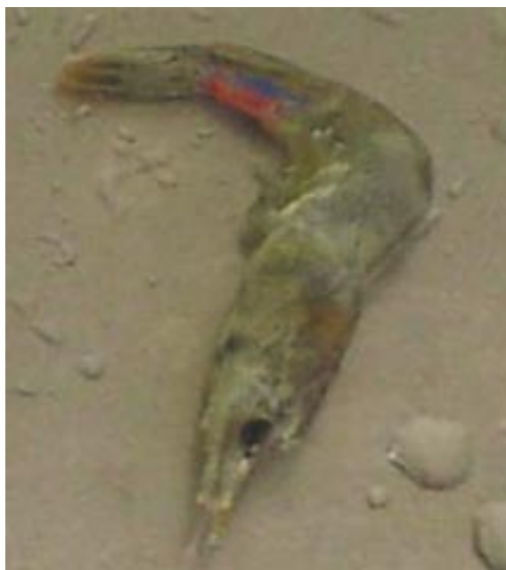
Camarón elastomerizado perteneciente a una familia evaluada en la selección a 130 días de edad.

evaluadas en etapas tempranas con variables medidas en etapas posteriores para determinar el peso relativo que hay que darle a cada componente en los esquemas de selección múltiple y poder construir los índices de selección, además de predecir el impacto final en el producto seleccionado.