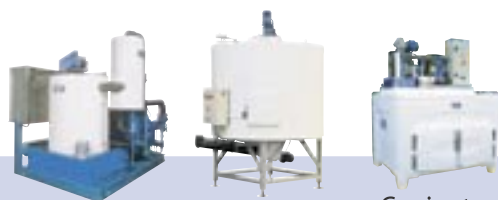
Pack-Hielo Silos Orbitales Conjuntos Geneglance

De 0.5 a 50 toneladas por día, simples, eficaces y fiables, los generadores de hielo en escamas Geneglance producen hielo de calidad.