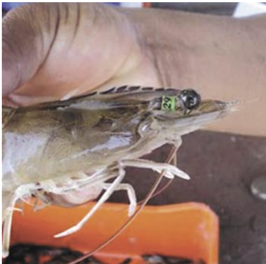
Progenitor empleado en la producción de familias.

The Genetic Improvement Breeding Program for weight at 130 days contemplates, for each generation, an experiment that involves a total of 108 families. The Breeding Program for the early larval growth stage (20 to 45 days of age) con-