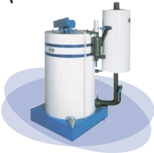
Generadores de hielo en escamas