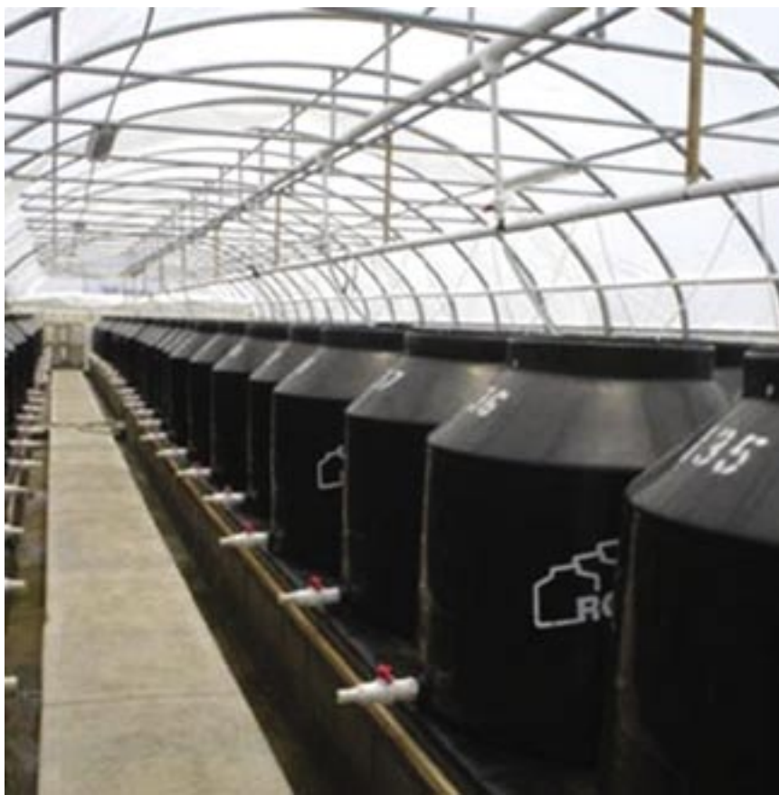
Tinacos con las familias para la evaluación genética temprana.

down. This entails two problems: in the long run, the genetic progress expected from breeding will tend to be reduced in each generation and negative effects associated with in-breeding depression (consanguinity) may be observed.